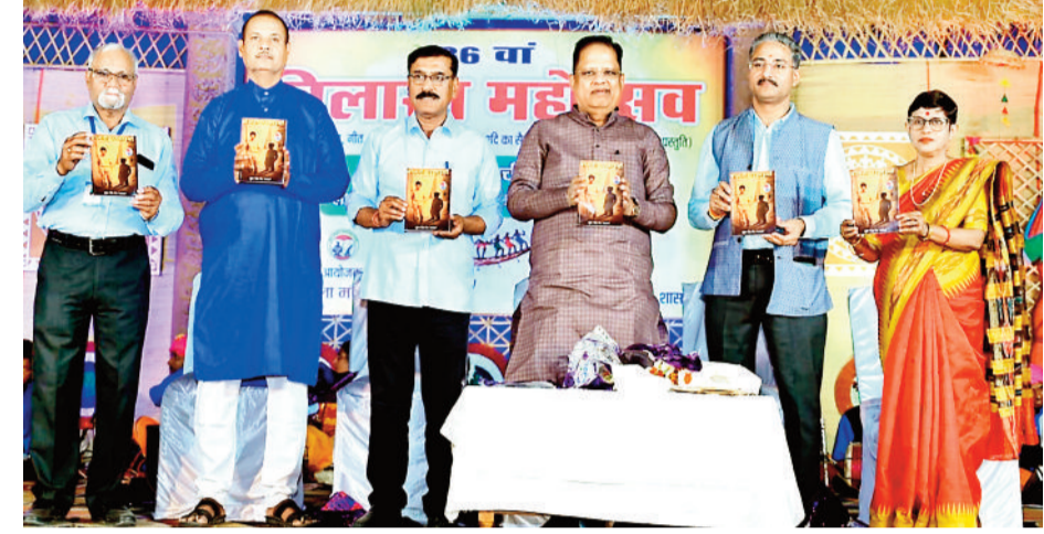
हरिभूमि न्यूज ►► बिलासपुर

ये बातें स्थानीय लालबहादुर शास्त्री स्कूल मैदान में आयोजित 36वें बिलासा महोत्सव में मुख्य अतिथि विधायक अमर अग्रवाल ने कही। उन्होंने कहा कि पूरे छत्तीसगढ़ में बिलासा महोत्सव की धूम रहती है, ऐसा आयोजन जहाँ मुझे अनेकों बार आने का अवसर मिला है। छत्तीसगढ़ में एक मात्र बिलासा कला मंच है जो लगातार 36 वर्षों से काम कर रहा है। स्थानीय और अंतरराज्यीय कलाकारों का प्रदर्शन देखने को मिलता है।