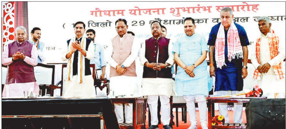
सीयू के आडिटोरियम में आयोजित कार्यक्रम में उपस्थित मुख्यमंत्री विष्णु देव साय, केंद्रीय मंत्री तोखन साहू व अन्य।