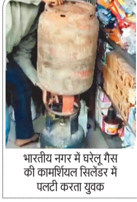
भारतीय नगर में घरेलू गैस की कामशियल सिलेंडर में पलटी करता युवक