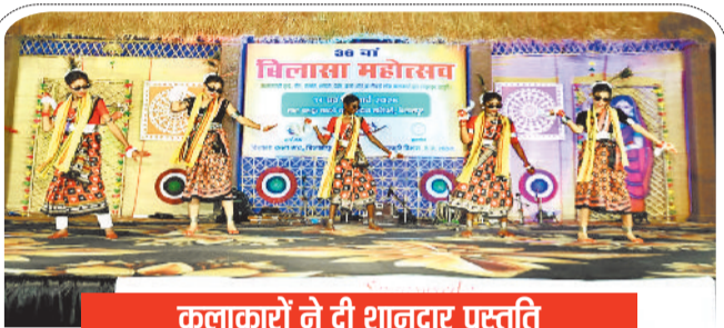
कलाकारों ने दी शानदार प्रस्तुति