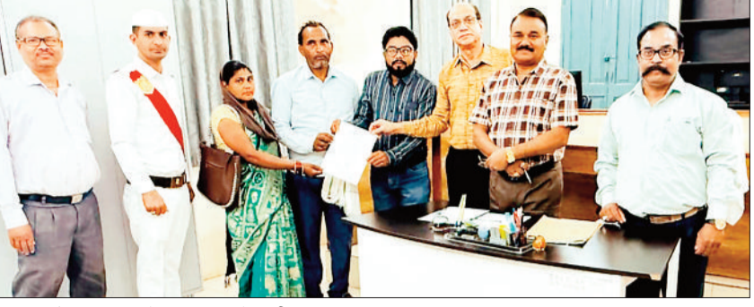
नेशनल लोक अदालत में पति-पत्नी में राजीनामा।