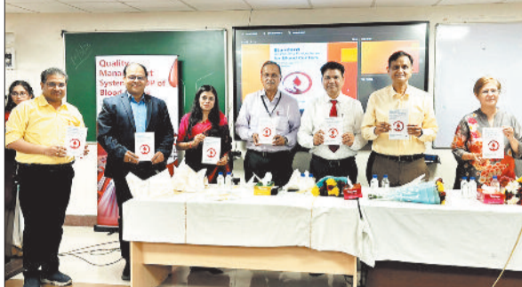
पुस्तक के विमोचन अवसर पर उपस्थित अतिथि।