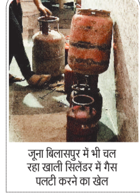
जूना बिलासपुर में भी चल रहा खाली सिलेंडर में गैस पलटी करने का खेल