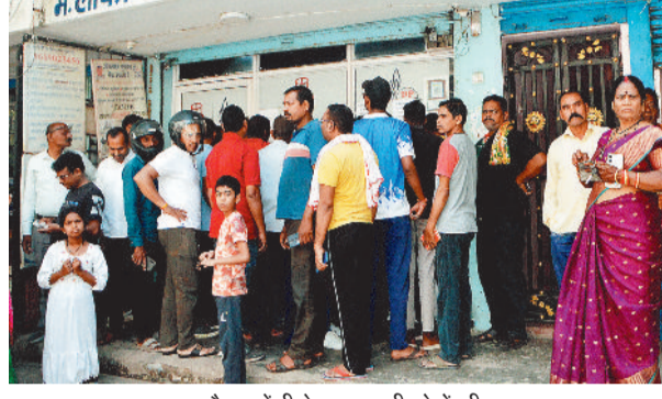
लाफगाढ़ गैस एजेंसी के बाहर लगी लोगों की कतार।