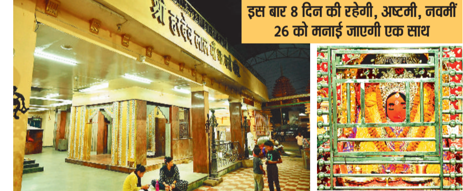
इस बार 8 दिन की रहेगी, अष्टमी, नवमी 26 को मनाई जाएगी एक साथ

बिलासपुर। शहर के काली मंदिर तिरफरा, हरदेव लाल मंदिर, शीतला मंदिर जीडीसी चौक, सतबहनिया मंदिर सहित अन्य सभी देवी मंदिरों में चैत्र नवरात्रि की तैयारियां शुरू हो गई हैं। सफाई एवं रंग-रोगन का काम किया जा रहा है। इस वर्ष तिथियों की संयोग के कारण नवरात्रि 8 दिनों की होगी। जिसमें अष्टमी व नवमी 26 मार्च को एक साथ मनाई जाएगी।